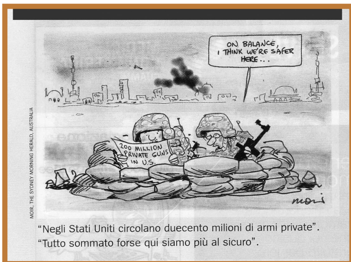
"Negli Stati Uniti circolano duecento milioni di armi private". "Tutto sommato forse qui siamo più al sicuro".

Perdona ! Ciò costa molto, lo so, ma ne vale il prezzo. Perdonare è una forma di creatività. Perdonare vuol dire: "risvegliare in se nuova vita e nuova felicità". Perdonare dona in te ed in altri nuove prospettive". Molto spesso devi perdonare : " settanta volte sette volte", sino all'infinito, perché tu stesso, hai bisogno di molto perdono.