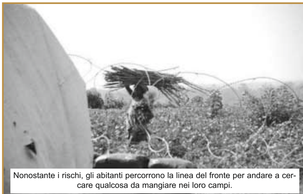
Nonostante i rischi, gli abitanti percorrono la linea del fronte per andare a cercare qualcosa da mangiare nei loro campi.

Alain Wandimoyi è fotografo e blogger a Goma. Si è recato mercoledì 22 giugno nelle zone di combattimenti a Rutshuru e, in particolare, nel villaggio di Ntamugenga, dove alcuni abitanti sono stati intrappolati in scontri: "I ribelli stanno molto vicino a Ntamugenga [i combattenti dell'M23 si trovano a meno di 10 km da questo villaggio, ndr.]. I caschi blu sono lì per proteggere gli abitanti, pertanto, ci sono dei militari ovunque nella zona e gli abitanti del villaggio che non sono